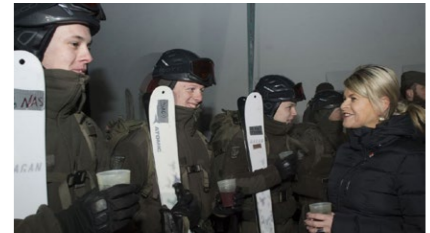
Verteidigungsministerin Tanner: „Dieser Einsatz auf diesem steilen Hang und auf vereisten Pisten erfordert gut ausgebildete Soldatinnen und Soldaten, wie es die Pioniere aus Salzburg auch sind.“

sondern auch ein unglaublich wichtiger Wirtschaftsstandort für die Regionen sind. Zu einer zukunftsfähigen Struktur gehört auch, dass wir die Selbstversorgungsfähigkeiten des Bundesheeres in Krisenzeiten stärken. Dazu müssen aber auch die Kasernen und ihre Infrastrukturen bedarfsgerecht und standortbezogen saniert werden. Aber natürlich haben wir auch aktuelle Herausforderungen zu bewältigen und Strukturverbesserungen anzugehen.