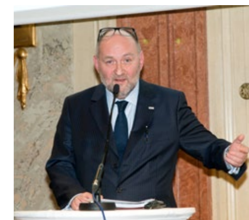
MinR Hager vom Bundesministerium für Inneres führte aus, dass es im Lichte aktueller Herausforderungen (z. B. Migration) gerade aufgrund der sehr komplexen, verwobenen Zuständigkeiten wichtig sei, die vorhandenen Sicherheitskonzepte stets weiterzuentwickeln.

In der vom Parlament beschlossenen Verteidigungsdoktrin von 1975 sowie einem daran angelegten