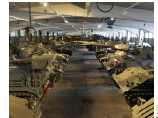
Die Streitkräfte in Europa veralten zusehends und werden bald zu einem einzigen Museum.

Europa hat offensichtlich nach dem Ende des Kalten Krieges nicht erkannt, dass der Kalte Krieg durch ein anderes Bedrohungsbild abgelöst wurde und in diesem Bedrohungsbild nur mehr die Vereinigten Staaten von Amerika in