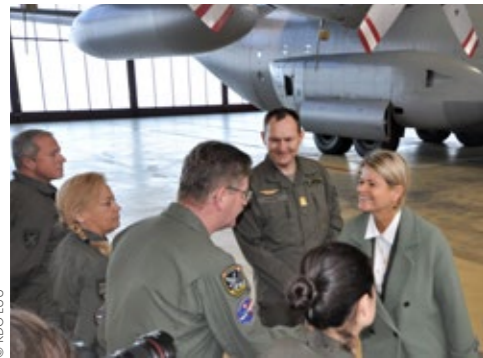
Bundesministerin Tanner bedankt sich bei der Crew der C-130

Das Österreichische Bundesheer führte auf Antrag des Außenministeriums (BMEIA) mit dem operativen Lufttransportsystem C-130 am Sonntag, den 2. Februar 2020 unter großem Medieninteresse eine Rückholaktion von österreichischen Staatsbürgern aus Frankreich durch. Diese wurden mit einem zivi-