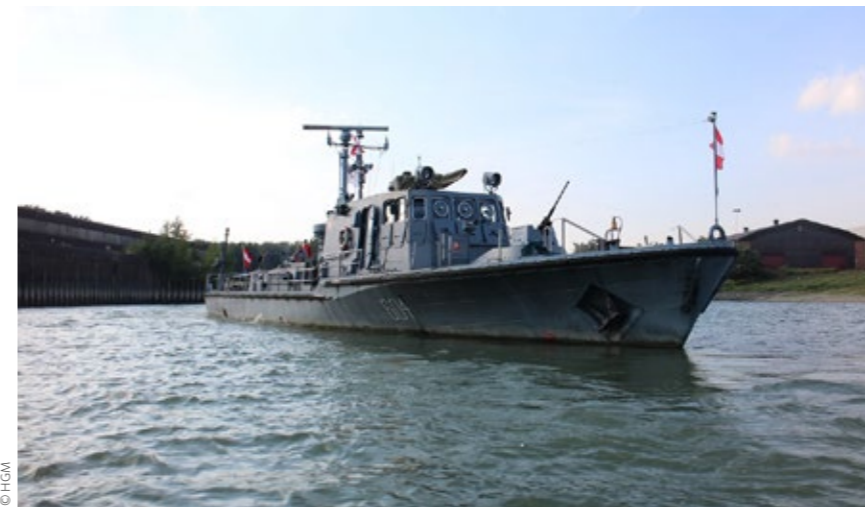
Auch Österreich hat sein einziges Patrouillenboot stillgelegt.

Gestatten Sie mir einige Sätze zur Euro-Krise loszuwerden: Die Einführung des Euro in Ländern, welche über unterschiedliche Wirtschaftsstrukturen verfügten ohne gleichzeitig auch die Fiskalpolitik im Euro-Raum einer gemeinsamen Regelung zu unterziehen, war aus wirtschaftswissenschaftlicher Sicht ein Fehler, der nicht mehr rückgängig gemacht werden kann. Europa wird bei der Bekämpfung auf lange Sicht wirtschaftlich gelähmt und es bleibt zu hoffen, dass nicht zu guter Letzt auch die Retter – Deutschland,