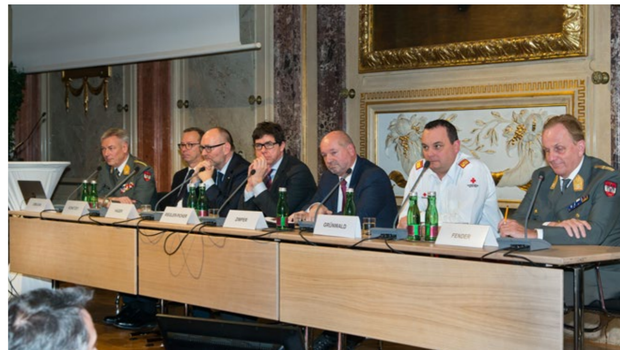
Nach den Vorträgen hatte das Podium jede Menge Fragen aus dem Publikum zu beantworten.

/ Aus wirtschaftlichen Gründen sind Reserven an Ausrüstung und Fahrzeugen als Vorsorge auf Krisen de facto