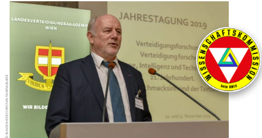
Der Vorsitzende der Wissenschaftskommission bei der Eröffnung der Jahrestagung.

Dem Bundesheer kommt bei der Bewältigung der zentralen Herausforderungen für die Sicherheit Österreichs eine wesentliche Rolle zu. Eine enge Zusammenarbeit mit ziviler Wissenschaft und Forschung erhöht dabei die Erfolgsaussichten bei der Erfüllung seiner verfassungsmäßigen Aufgaben sowie der technologischen Weiterentwicklung für künftige Herausforderungen.