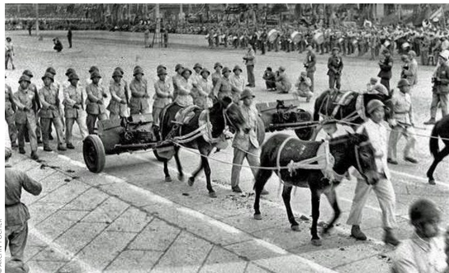
Die Zeiten der sogenannten „Heugabel-Infanterie“ sind in China schon längst vorbei. China verfügt heute über die modernsten Streitkräfte der Welt.

Technology Corporation (CASC/www.spacechina.com), die Beijing Cisri-Gaona Materials & Technology (www.cisri-gaona.com.cn), Aviation Industry of China (AVIC/www.avic.com.cn) und weitere kleinere Unternehmen. Landsysteme erzeugen China South Industries Group Corporation (CSGC/www.csgc.com.cn), China Nuclear Engineering and Construction Corpora-