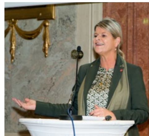
In ihren Grußworten lobte die Bundesministerin für Landesverteidigung, Mag. a Klaudia Tanner (die selbst Mitglied einer Teilorganisation des Dachverbandes ist), das Engagement der Plattform und sprach den Funktionären ihren persönlichen Dank aus.

Erwartungsgemäß musste die Verteidigungsministerin mitteilen, dass sie noch keine Antworten auf budgetäre Fragen geben könne. Dem wachen Leser verschließt sich im Regierungsprogramm ohnehin nicht die übersehbare Minderpriorisierung wehrpolitischer Notwendigkeiten. So kann man lesen: „Die finanzielle Situation und der Zustand des Bundesheeres erfordern neue Konzepte (...). Daher müssen auch die Aufgaben, Strukturen und Mittel der Landesverteidigung (...) neu gestaltet werden.“ – das heißt, dass nicht die Herausforderung das notwendige Budget bestimmen, sondern das vorhandene Budget den Rahmen der Möglichkeiten begrenzt bzw. wie es die Bundesministerin notgedrungen formulierte: „Es wird eine Notwendigkeit sein, die Aufgaben des Bundesheeres nach der Einsatzwahrscheinlichkeit zu reihen und die dafür erforderlichen Strukturen zu ‚verbessern‘.“