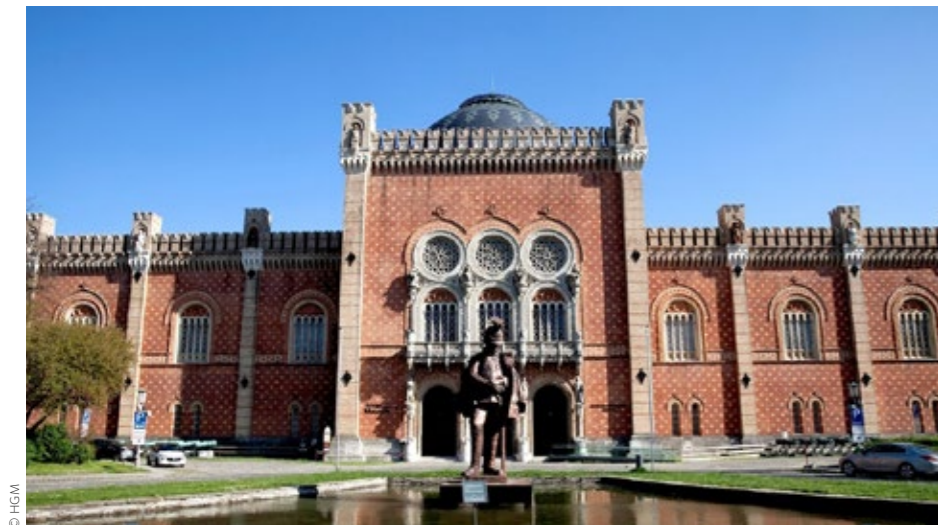
Europäische Militärmuseen sind ein Anziehungspunkt für Touristen – bald werden dies auch die Streitkräfte sein.

der Lage sind, als einzige Weltmacht den Part des „Guten“ spielen zu können. Sie würden zwar gerne Hilfe von Verbündeten annehmen, können sich aber auf die Europäer nicht mehr verlassen, da die Truppen der Europäer in dem neuen Bedrohungsbild alleine und ohne US-amerikanische Hilfe nicht mehr einsetzbar sind. (Red.ÖOG, HaPö) ✘