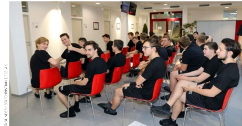
Gemäß dem Regierungsprogramm soll die Stellung als wichtige Säule der Gesundheitsvorsorge (Stellung als Vorsorgeuntersuchung) weiterentwickelt werden.